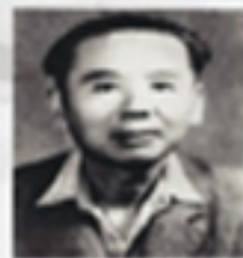
● ● ●