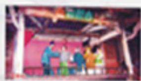
◎ 漢語辭書例證 · 卷四 · 續